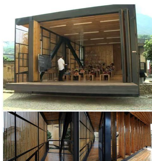
Gambar 2. Pengaburan batas fisik dalam rancangan The Bridge School di Fujian, China

Tulisan Grosz (2001) mengenai kulit dan loci menggambarkan bahwa elemen pembentuk ruang seharusnya bukan berfungsi sebagai batas konkrit secara fisik yang memisahkan antara luar dan dalam, melainkan sebuah membran dimana terjadi sebuah proses adaptasi antara lingkungan satu dengan yang lain. Mendukung hal ini, istilah “ blurring ” yang disebutkan oleh Smith (2004) untuk mendefinisikan interior juga dapat diaplikasikan pada batas fisik antara interior dan eksterior dengan cara mengaburkan batas tersebut. Ada beberapa contoh kasus proyek yang pernah didesain dengan teknik pengaburan batas fisik. The Bridge School (gambar 2) merupakan sebuah sekolah di daerah pedesaan di area kaki gunung yang terletak di antara rumah-rumah tradisional Fujian, China yang dimanakan tulou .