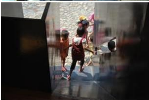
Gambar 8. Kulit bangunan dijadikan sekaligus elemen arsitektur maupun elemen interior untuk menghubungkan kegiatan bermain anak-anak di dalam dan di luar bangunan.