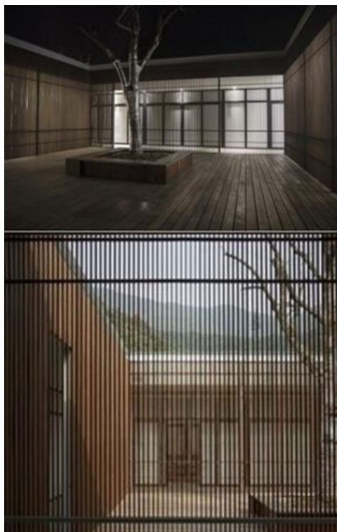
Gambar 3. Pengaburan batas antara interior, courtyard dan pemandangan alam dengan menggunakan tabir bambu

dengan potensi lingkungan sekitarnya dengan cara mengaburkan batas fisik.