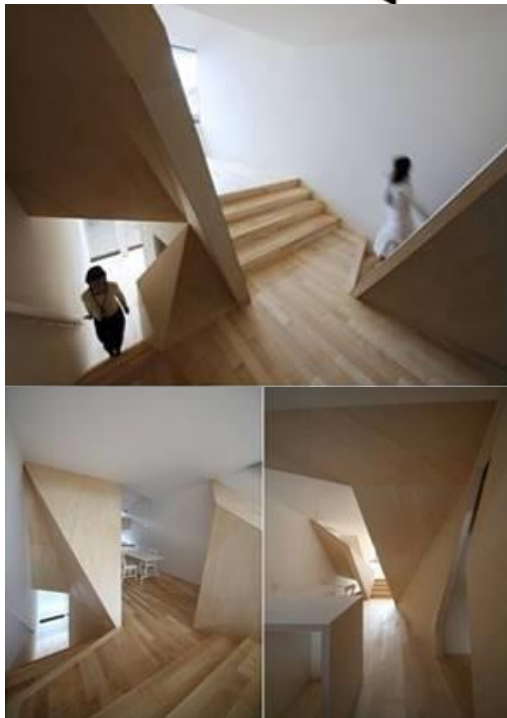
Gambar 4. Skema manipulasi programatik pada desain rumah tinggal New Kyoto House melalui dinding bersudut irregular menunjukkan aplikasi pemahaman interior sebagai penghubung antara manusia, aktivitas dan potensi lingkungannya