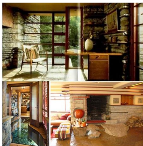
Gambar 5. Inovasi kontinuitas material lingkungan eksternal ke dalam interior merupakan salah satu teknik penting yang digunakan oleh Wright untuk menghubungkan aktivitas manusia dengan potensi lingkungan sekitar

interior maupun penggunaannya sibuk dalam mengisi ruang dalam mereka dengan produk-produk yang memberi kenyamanan instan sehingga mereka telah membangun tembok yang solid dan menutup diri dari potensi lingkungan alam sekitar. Belajar dari sejarah, ada beberapa arsitek dunia di masa lampau yang tidak pernah menganggap harus adanya perbedaan yang ekstrim antara lingkungan eksterior dan interior, mendukung pemahaman Caan (2011). Semua bangunan didesain dengan pola pikir dan konsep yang menyeluruh antara ekterior dan interior dimana pengolahan interior, terutama dalam hal material dan penataan ruang dirancang untuk beradaptasi dengan alam sekitar. Karya Falling Water dari Frank Lloyd Wright (gambar 5) merupakan sebuah rumah tinggal yang begitu terkenal karena berhasil membuat perancangan yang dapat begitu menyatu dengan potensi alamnya.