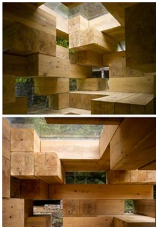
Gambar 7. Elemen arsitektur balok-balok kayu dijadikan elemen interior yang sekaligus berfungsi sebagai tangga dan perabot dalam karya Final Wooden House oleh Fujimoto.